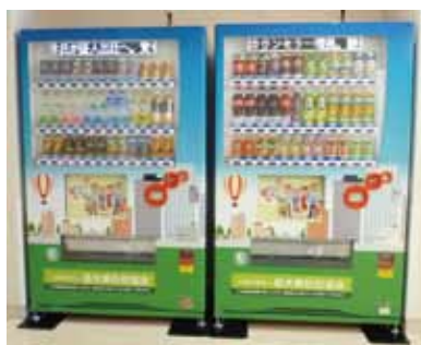
寄付金付自動販売機の設置例